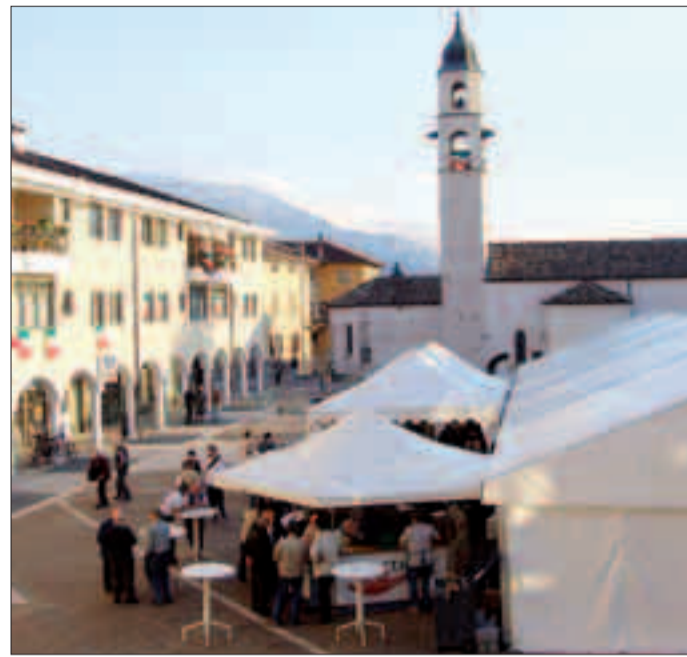
Per organizzare l'evento vengono coinvolti moltissimi volontari

gi legati al Risorgimento. Mercoledì sera l'intrattenimento con musica e cabaret allietterà i presenti al tendone in piazza, mentre il giorno successivo (giovedì 29 settembre) sarà la volta del concerto-tributo ai Nomadi. Venerdì 30 settembre il circolo culturale di Cognola propone la classica «tombola per famiglie», ma sempre a proposito di nuclei famigliari sarà la stirpe dei Pedrotti a festeggiare con lo spettacolo «La saga del Pedro» ideato per l'occasione dal comico trentino Lucio Gardin. Il rifugio antiaereo costruito sul Dos Castion durante l'ultima guerra e la mostra micologica saranno le due principali attrazioni del pomeriggio di sabato 1 ottobre, cui seguirà la tradizionale serata danzante. Si termina domenica 2 ottobre, quando il programma prevede l'inaugurazione di alcuni nuovi Murales legati alla storia del Canopi, cui seguirà il momento sacro della Santa Messa.